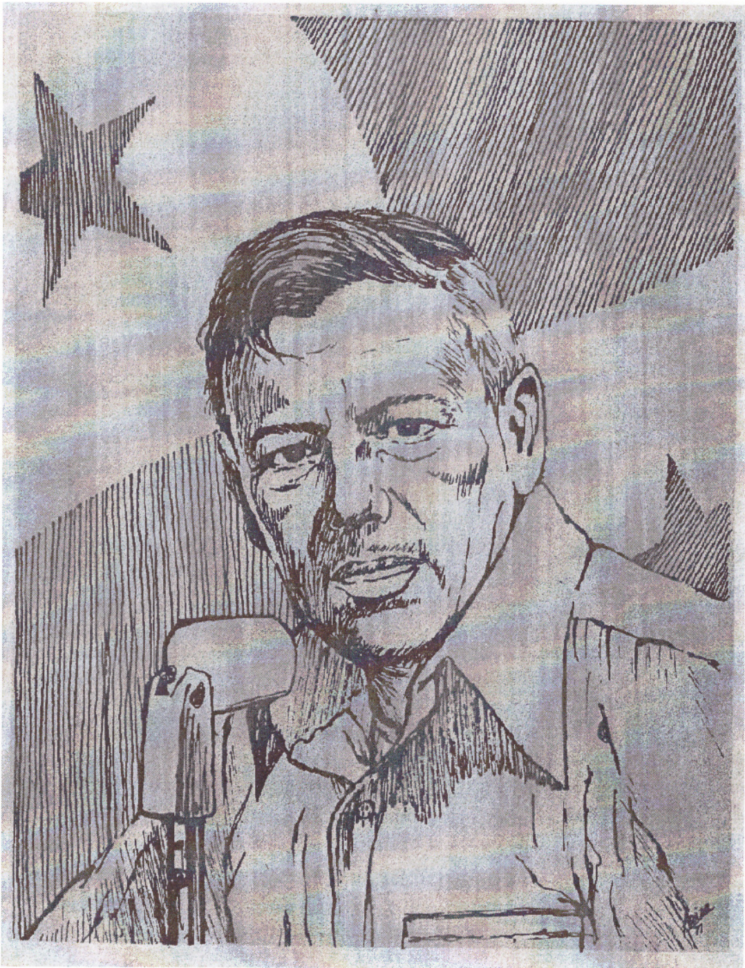
Retrato del general Omar Torrijos que ilustra el ensayo "Destino de un Continente". Publicado en el libro Español, Lengua de mi Tierra No. 7