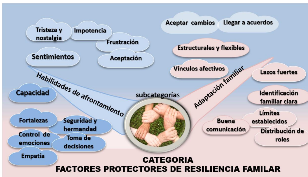
Figura N° 1. Categoría 1.

El Afrontamiento individual y familiar al igual que la adaptación son respuestas de suma importancia para reducir el impacto de alguna noticia, información positiva o negativa o el diagnóstico de una enfermedad como lo es el del Cáncer del Colon Avanzado.