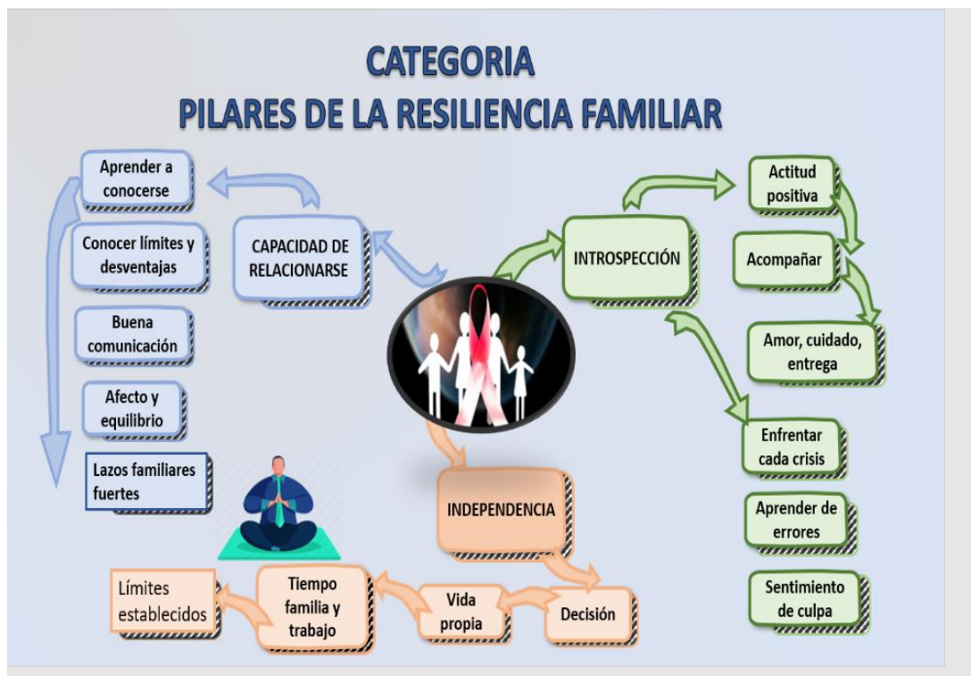
Figura N° 3 Categoría 3.

Objetivo: Describir los pilares de la Resiliencia Familiar