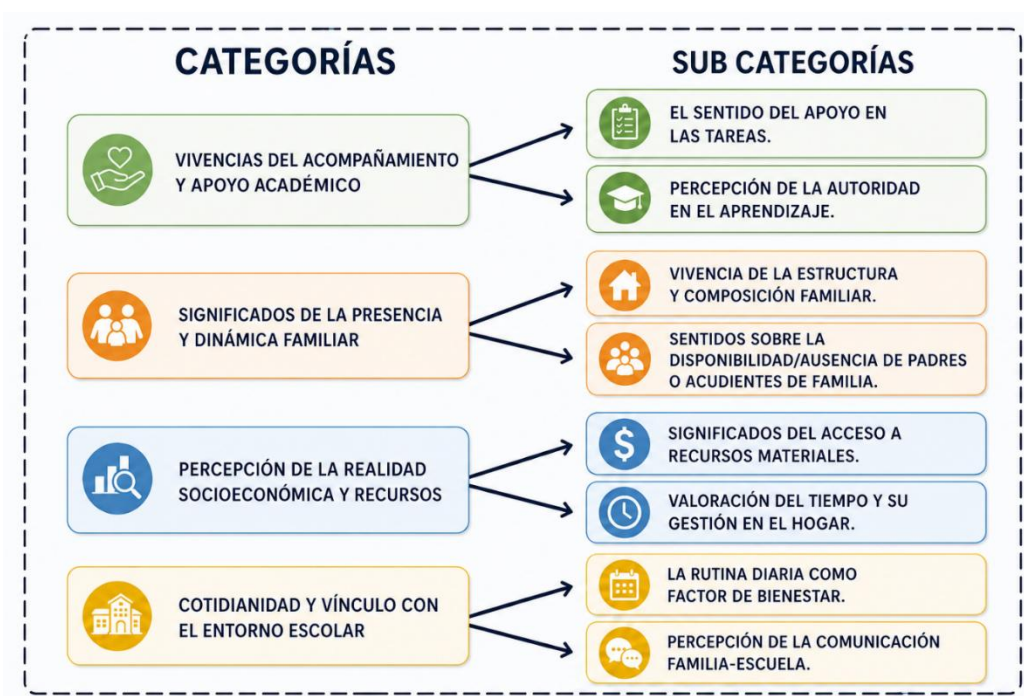
Figura N°. 1: Categorías y Subcategorías

profundiza en la conexión entre teoría y práctica al generar ideas entre lo investigado y lo que se vive en el campo. En la Categoría Vivencias del Acompañamiento y Apoyo Académico.