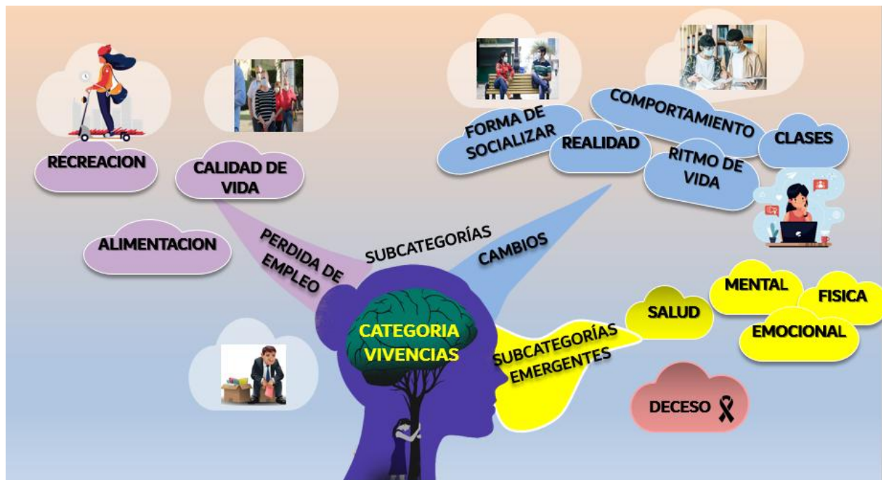
Ilustración 1 Categoría Vivencias

Con relación a la categoría vivencias y las subcategorías pérdida del empleo, cambios y la subcategoría emergente salud, es importante destacar que la pérdida del empleo del proveedor afecta la calidad de vida, en cuanto a la alimentación y recreación no sólo de los estudiantes universitarios sino también de cada miembro de la familia. De igual forma los cambios en su realidad, forma de socializar, ritmo de vida, comportamiento e incluso en la metodología de recibir sus clases.